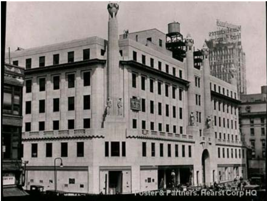
Foster & Partners. Hearst Corp HQ