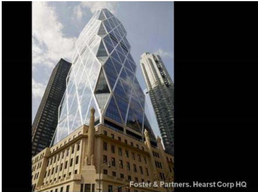
Foster & Partners. Hearst Corp HQ