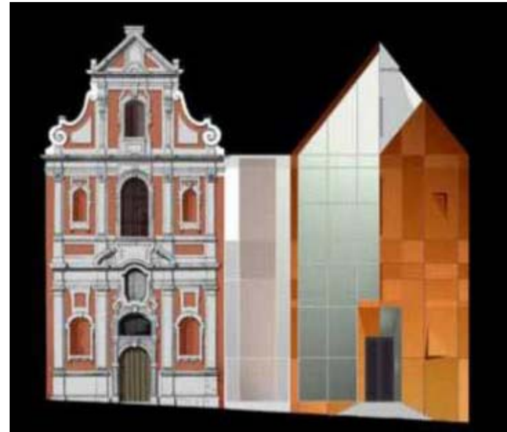
Construire après les autres: restauration et extension de la Chapelle des Briggittines, Bruxelles (2001 -) Andrea Bruno